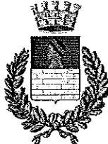
Comune di Muro Leccese (LE)